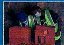
Séances de pratique